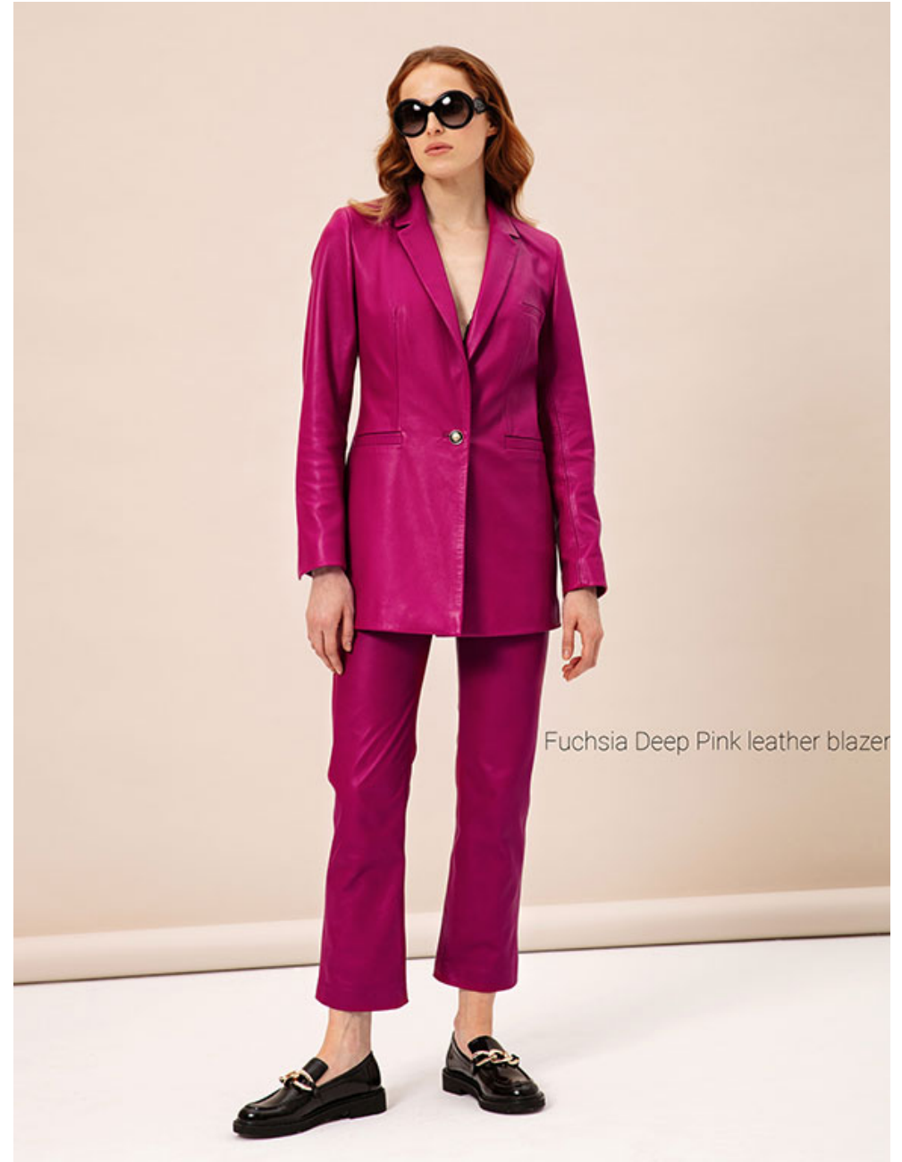
Fuchsia Deep Pink leather blazer