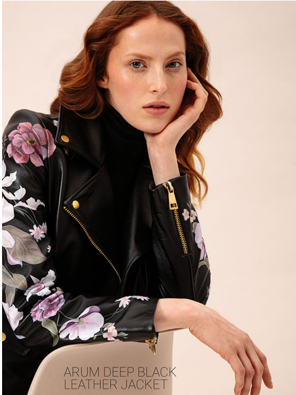
ARUM DEEP BLACK LEATHER JACKET

Height 175 / Bust 88 / Waist 64 / Hip 91 / Size 36 / Shoes 39 / Hair red / Eyes green /