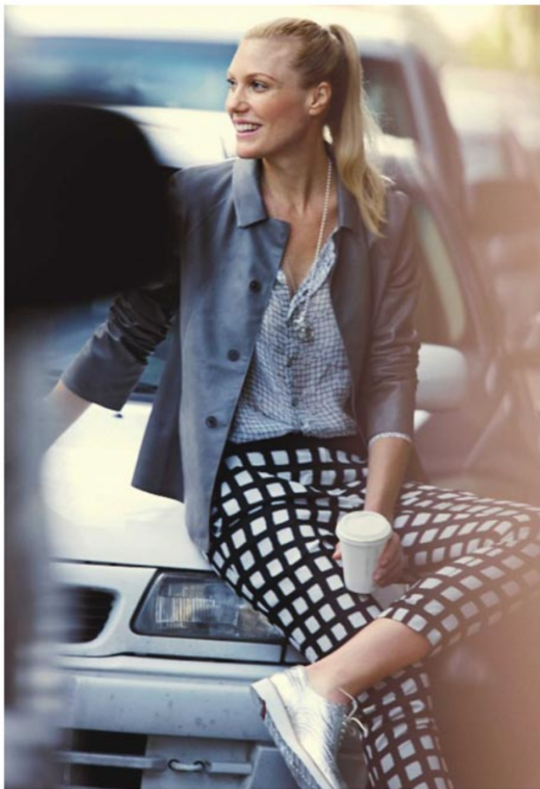
KACHELGEMUSTERT (linke Seite) Ungefülltes Jackett mit Ikatmuster; Brigitte von Boch, ca. 130 Euro. Ärmelloses Kleid mit gepunktetem Oberteil und kariertem Rock; Tibi, ca. 425 Euro. Strohhut: Mühlbauer.